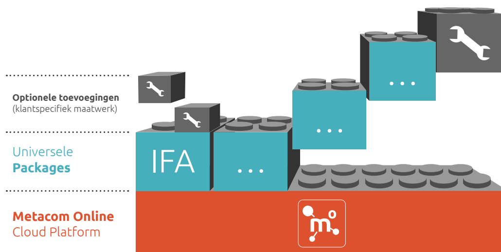
Afbeelding 1: De opbouw van de Metacom Online package-oplossing

De IFA package is uit te breiden met andere Metacom Online packages, zoals bijvoorbeeld urenregistratie en werkbonnen. Zo kun je meerdere bedrijfsprocessen automatiseren in één omgeving. Net als IFA zijn andere Metacom Online packages flexibel ingericht zodat ze te modelleren zijn en specifiek aansluiten op je bedrijfsproces.